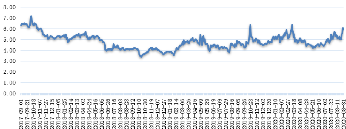
发行人最近三年收盘价（元/股）