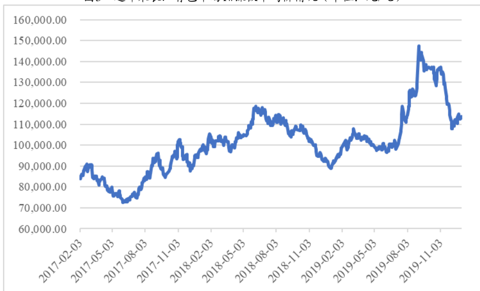
图3 近年来长江有色市场1#镍板平均价情况(单位:元/吨)

公司主要原材料为不锈钢圆钢、不锈钢卷板和不锈钢平板,其中,镍价走势为不锈钢和特种合金价格走势的风向标,上游原材料价格受镍价走势影响较大。受环保政策压力影响,2019年,我国电解镍产量为195,956.00吨,同比下降3.12%。我国是镍的消费大国,但在全球镍矿垄断的背景下,不具有定价权,导致国内镍价走势受制于国际市场。受大宗商品市场波动影响,2019年镍价震荡幅度较大,上半年小幅下滑,下半年大幅上升然后回调。镍、铬铁等原材料价格的大幅波动对工业用不锈钢生产成本影响较大,从而造成产品毛利率指标一定程度的波动。此外,原材料价格的持续波动会对企业的经营管理带来一定影响,原材料价格持续上涨将占用企业更多的流动资金,从而加大资金周转的压力。