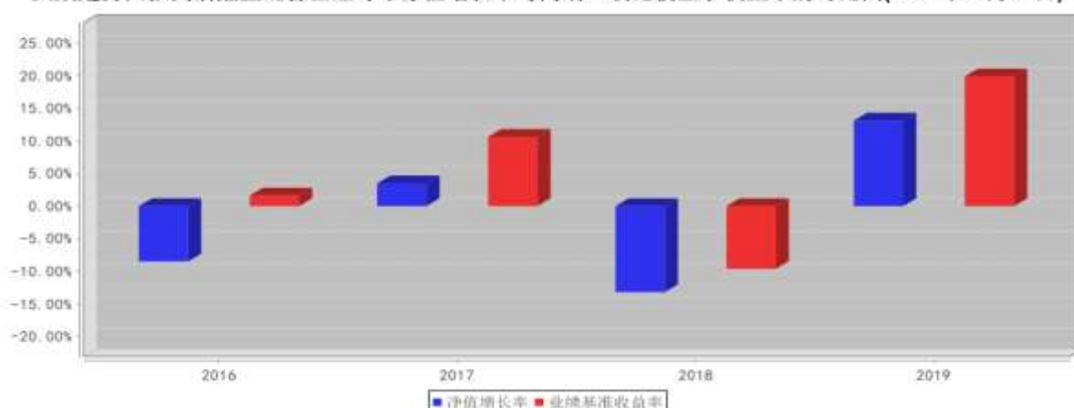
大成趋势回报灵活配置混合基金每年净值增长率与同期业绩比较基准收益率的对比图(2019年12月31日)