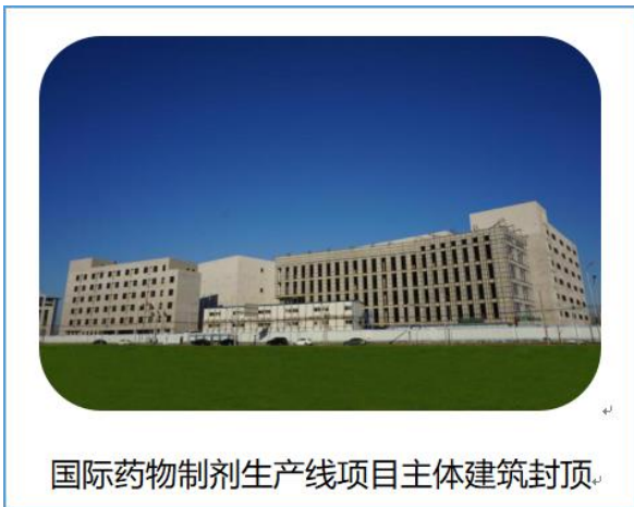
国际药物制剂生产线项目主体建筑封顶。