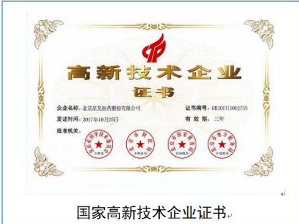
国家高新技术企业证书。