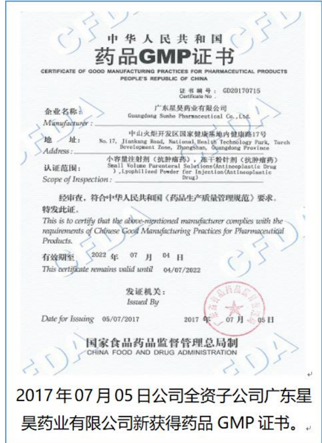
2017年07月05日公司全资子公司广东星昊药业有限公司新获得药品 GMP 证书。