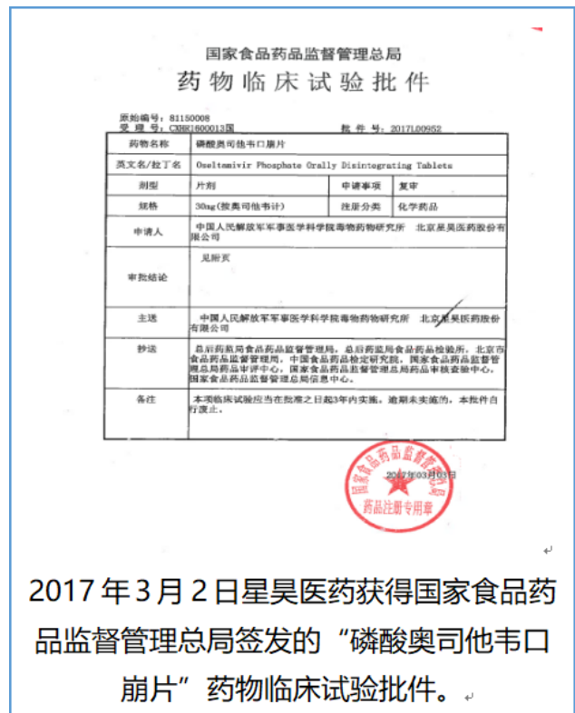
2017年3月2日星昊医药获得国家食品药品监督管理局签发的“磷酸奥司他韦口服崩片”药物临床试验批件。