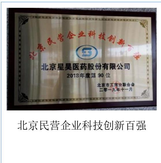
北京民营企业科技创新百强