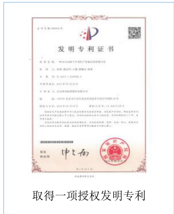
取得一项授权发明专利