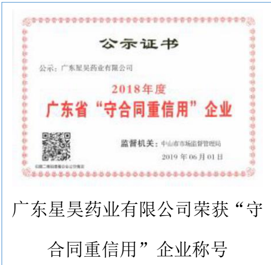
广东星昊药业有限公司荣获“守合同重信用”企业称号