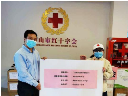
广东星昊向中山市红十字会捐赠人民币100万元用于疫情防控。