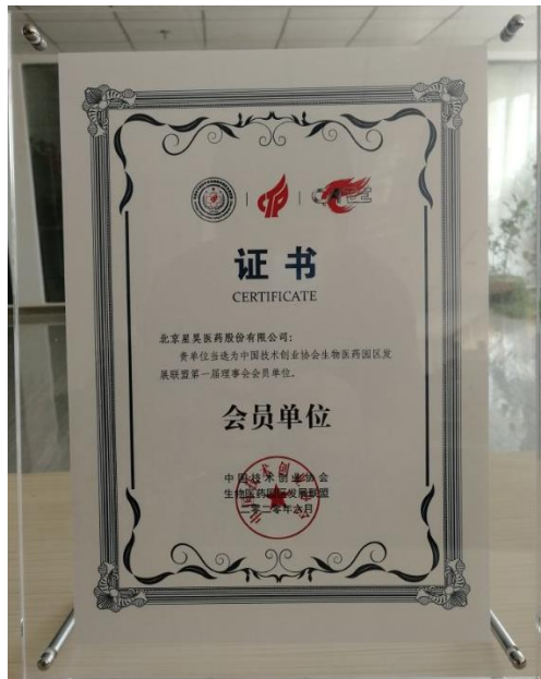
星昊医药当选为中国技术创业协会生物医药园区发展联盟第一届理事会会员单位。