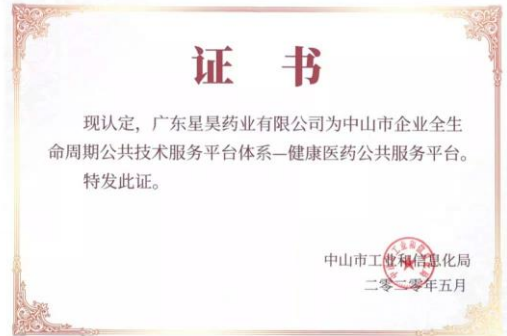
广东星昊的“健康医药公共服务平台”被认定为生物医药板块的“全生命周期公共技术服务平台”。