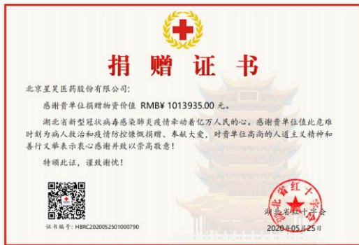
星昊医药向湖北省捐赠药品，湖北省红十字会颁发的《捐赠证书》。