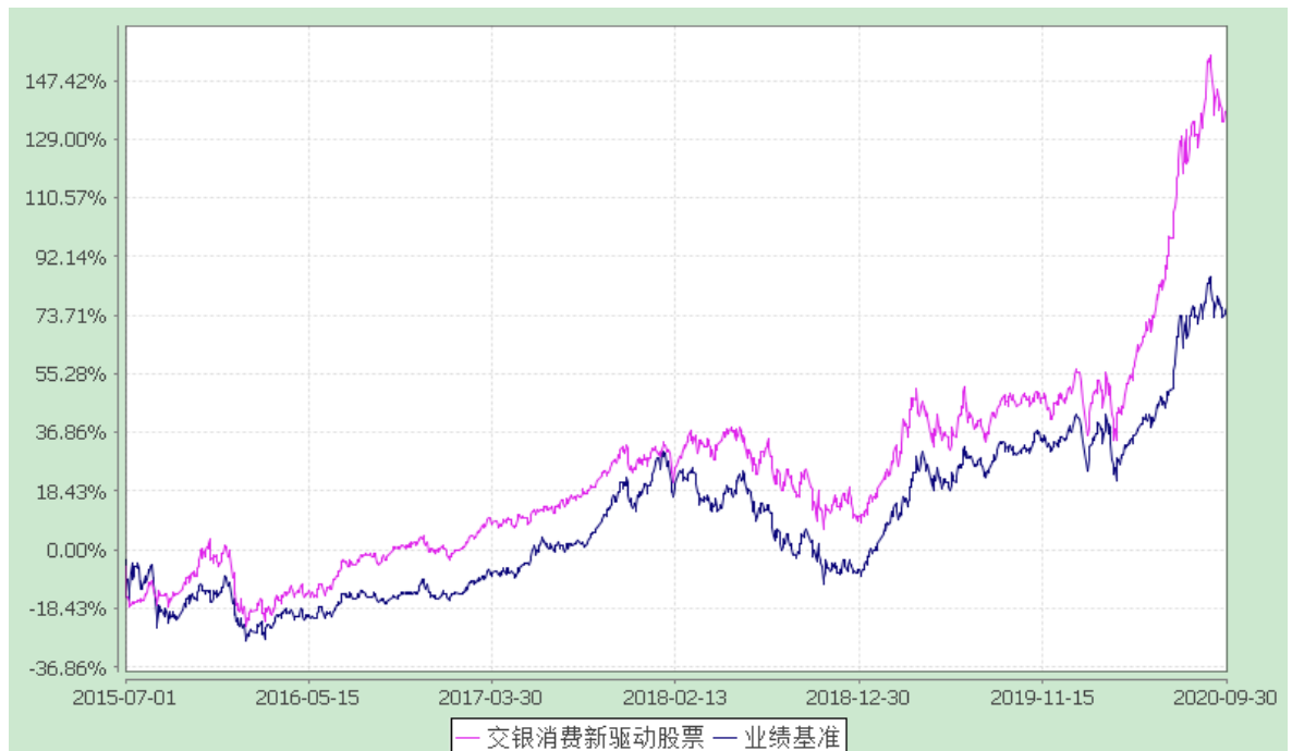
交银施罗德消费新驱动股票型证券投资基金 份额累计净值增长率与业绩比较基准收益率历史走势对比图 (2015年7月1日至2020年09月30日)

(1) 自基金转型以来基金份额累计净值增长率变动及其与同期业绩比较基准收益率变动的比较