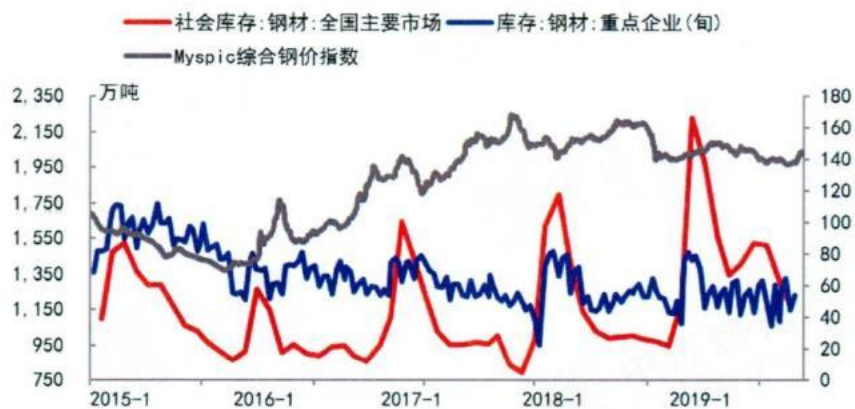
图 4 2019 年社会库存发挥“蓄水池”作用

预计 2020 年钢价震荡下行，库存的“蓄水池”作用可维持供需弱平衡。纵观 2020 年全年，钢材供给量增速将高于需求增速，供应偏宽松，未来钢价下行压力较大，但企业库存仍处于低位，在社会库存后可充当第二层“蓄水池”吸收过剩供给、打赢蓝天保卫战下继续严格环保限产，将缓解钢价的下降幅度。