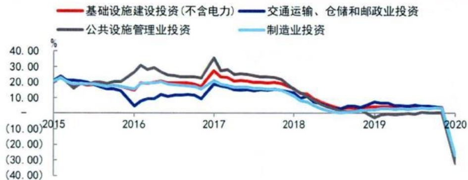
图 1 当前我国基建投资及制造业投资增速仍处于下行阶段

钢结构行业发展与经济增长、基础设施建设和制造业投资密切相关，其运行受宏观经济发展波动影响较大，具有一定的周期性。受经济结构转型、金融去杠杆及严查政府隐性债务影响，我国基建及制造业等固定资产投资增速自 2017 年起明显步入下行通道。2020 年 1-2 月，受新冠疫情影响，固定资产投资端增速继续下滑，1-2 月我国基础设施建设投资（不含电力）和制造业同比下滑 30.3%。