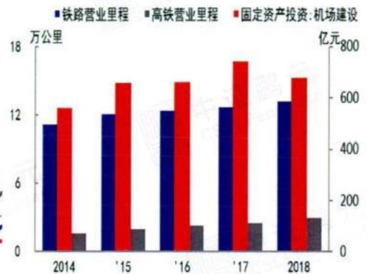
图 3 轨道交通及机场建设投资空间广阔