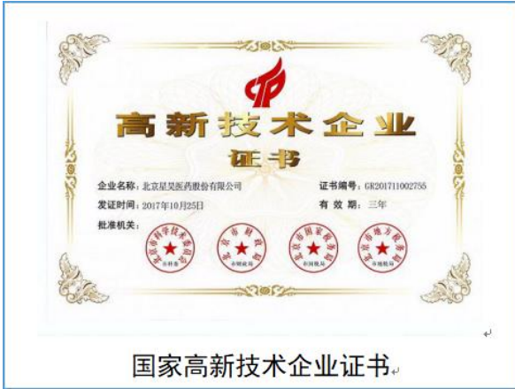
国家高新技术企业证书。