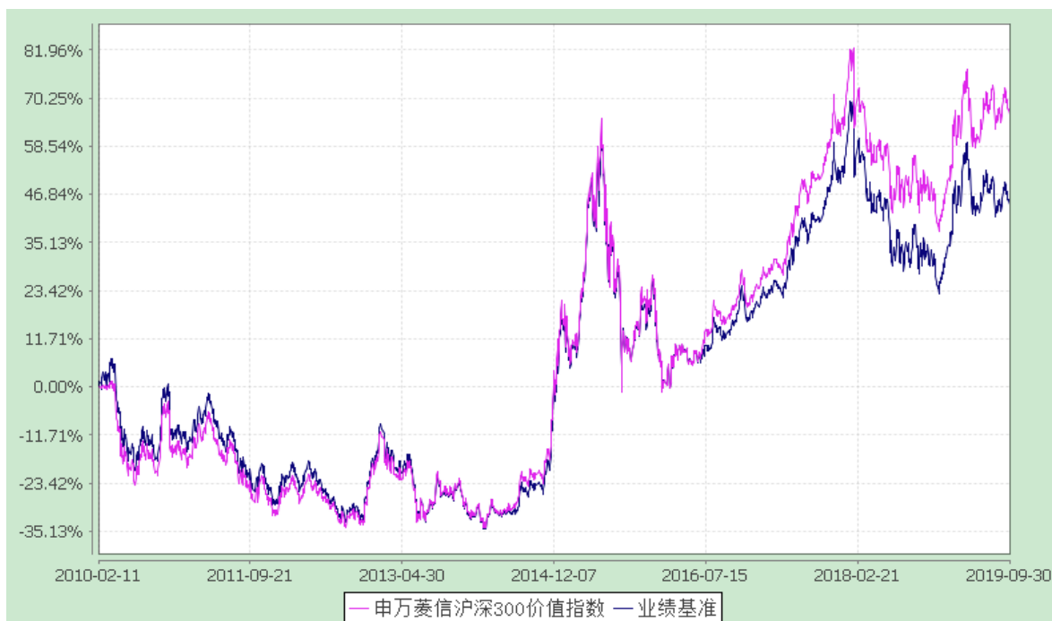
申万菱信沪深 300 价值指数证券投资基金 C 累计净值增长率与业绩比较基准收益率的历史走势对比图 (2019 年 8 月 8 日至 2019 年 9 月 30 日)