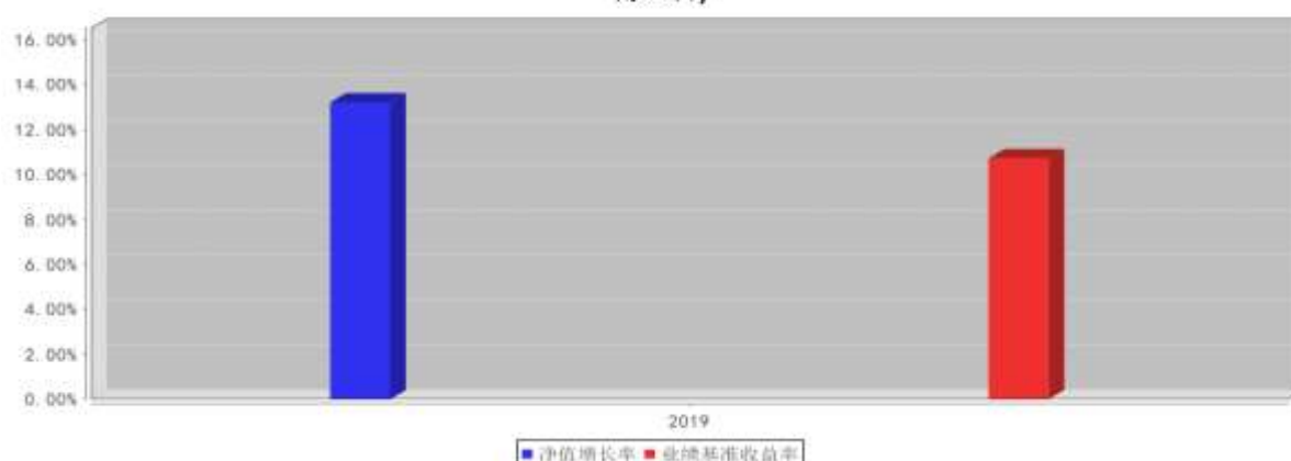
大成科创主题3年封闭运作灵活配置混合基金每年净值增长率与同期业绩比较基准收益率的对比图(2019年12月31日)