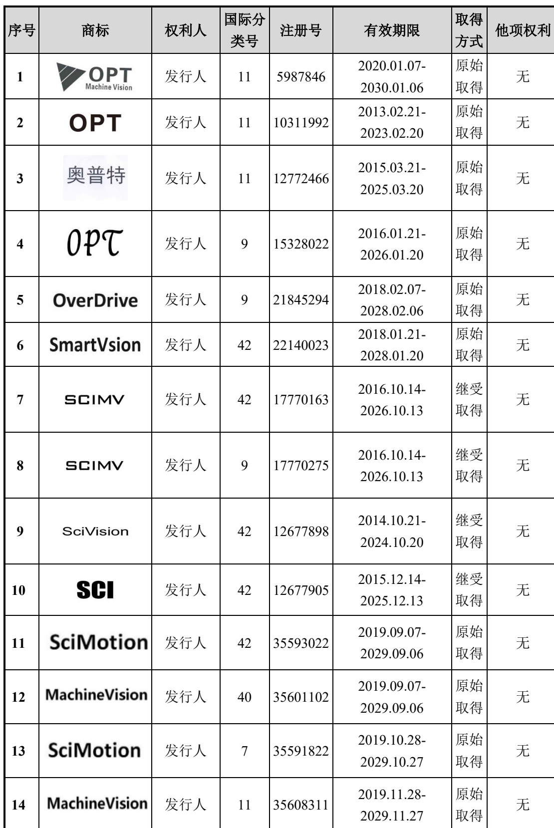
附表一：发行人及其子公司拥有的境内注册商标情况