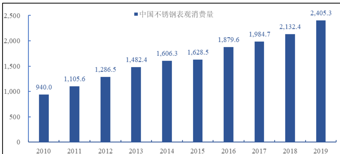
2010~2019年中国不锈钢表观消费量（单位：万吨）