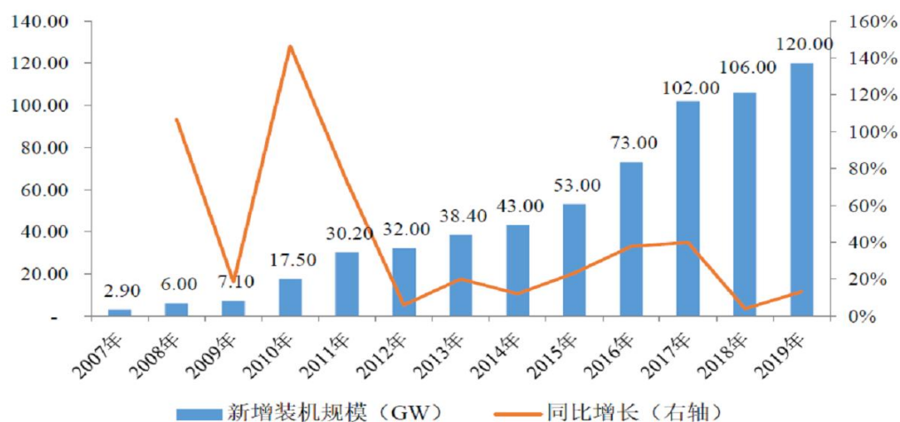
2007年至2019年全球光伏新增装机容量变化情况

在人类目前大规模使用的可再生新能源中，光伏发电具有可开发利用总量大、受资源分布限制小、安全可靠、对环境的影响小等独特优势。近年来随着光伏产业链成本的下降、光伏组件转换效率的提高，光伏发电已成为全球发展最快的可再生新能源之一。从短期趋势来看，根据2020年版《BP世界能源统计年鉴》，2019年全球光伏发电量同比增长24.25%，远高于12.55%的风能发电量增速及5.97%的其他可再生能源发电量增速。同时全球光伏产业规模也在持续扩大，2019年全球光伏新增装机规模达到120GW，同比增长13.21%。