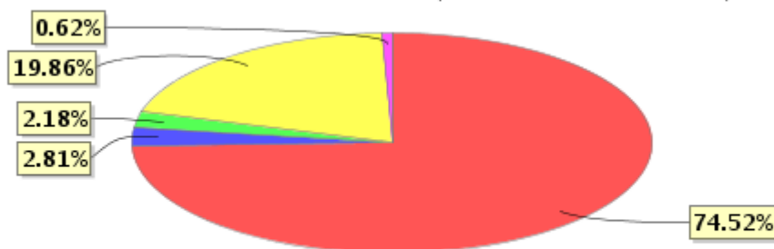
投资组合资产配置图表(2020年9月30日)