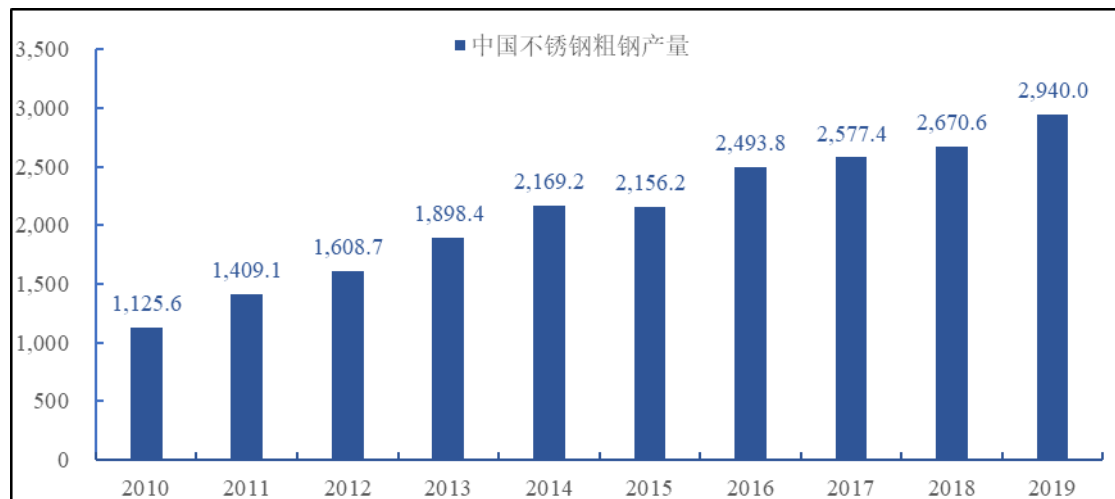
2010~2019 年中国不锈钢粗钢产量（单位：万吨）

从募投项目产品的下游市场来看，在不锈钢产量方面，根据中国特钢企业协会数据，2019 年中国不锈钢粗钢产量 2,940 万吨，同比增长 10.1%；在不锈钢需求量方面，根据中国特钢企业协会数据，2019 年中国不锈钢表观消费量为 2,405.3 万吨，同比增长 12.8%，且近年来中国不锈钢表观消费量呈逐年增加态势。