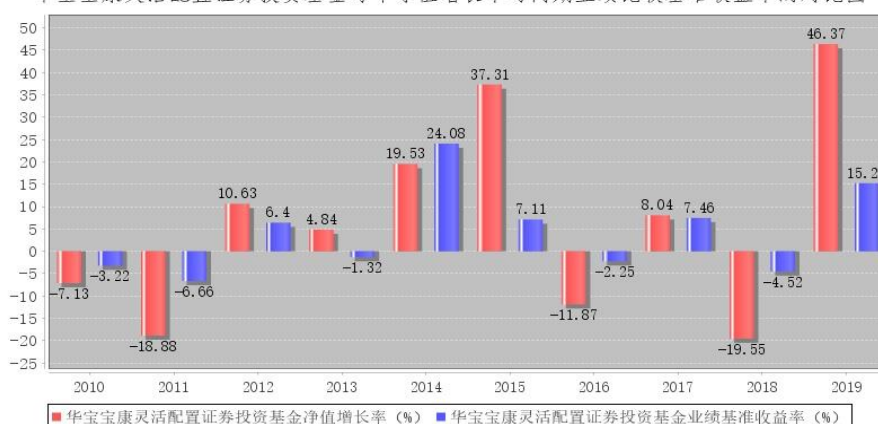
华宝宝康灵活配置证券投资基金每年净值增长率与同期业绩比较基准收益率的对比图