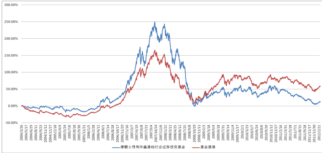
自基金合同修改以来基金累计份额净值增长率变动及其与同期业绩比较基准收益率变动的比较