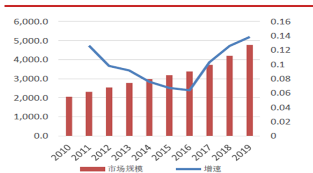
我国化妆品市场正以高速增长

乙醛酸是一种重要的医药中间体和有机合成中间体，在医药（合成口服青霉素、尿囊素，尿囊素可用做皮肤创伤的良好愈合剂、高档化妆品的添加剂以及植物生长调节剂）、香料、油漆、造纸、精细化工等领域有广泛的应用。目前，国内外合计每年约有 2 万吨高品质晶体乙醛酸、3 万吨高品质乙醛酸水溶液和 20 万吨普通乙醛酸水溶液的市场需求。高品质乙醛酸市场需求日益增长，供应缺口较大，国内尚没有规模化的高品质乙醛酸工业企业，供需矛盾较为突出。该项目的建设将填补我国大规模生产高品质晶体乙醛酸的空白，不仅可满足国内医药、食品、香料等行业对高品质乙醛酸产品的需要，同时产品可以实现出口，带动我国乙醛酸行业及其下游生物化工行业的健康快速发展，具有广阔的市场发展前景。