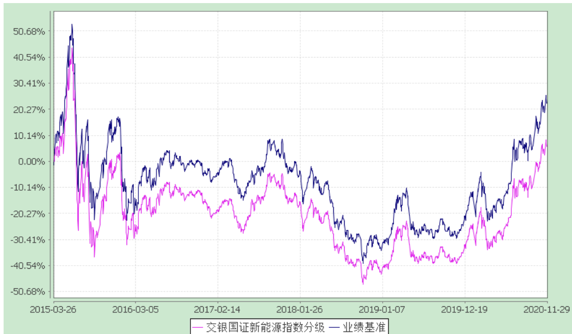
交银施罗德国证新能源指数分级证券投资基金 份额累计净值增长率与业绩比较基准收益率历史走势对比图 (2015年3月26日-2020年11月29日)

注：本基金建仓期为自基金合同生效日起的6个月。截至建仓期结束，本基金各项资产配置比例符合基金合同及招募说明书有关投资比例的约定。