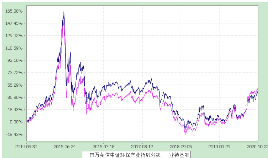
申万菱信中证环保产业指数分级证券投资基金 份额累计净值增长率与业绩比较基准收益率的历史走势对比图 (2014年5月30日至2020年10月22日)

注：本基金于2020年10月23日转型，转型前的基金合同于2020年10月22日终止。