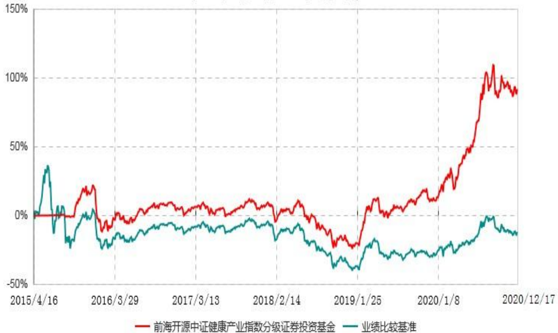
前海开源中证健康产业指数分级证券投资基金累计净值增长率与业绩比较基准收益率历史走势对比图 (2015年04月16日-2020年12月17日)