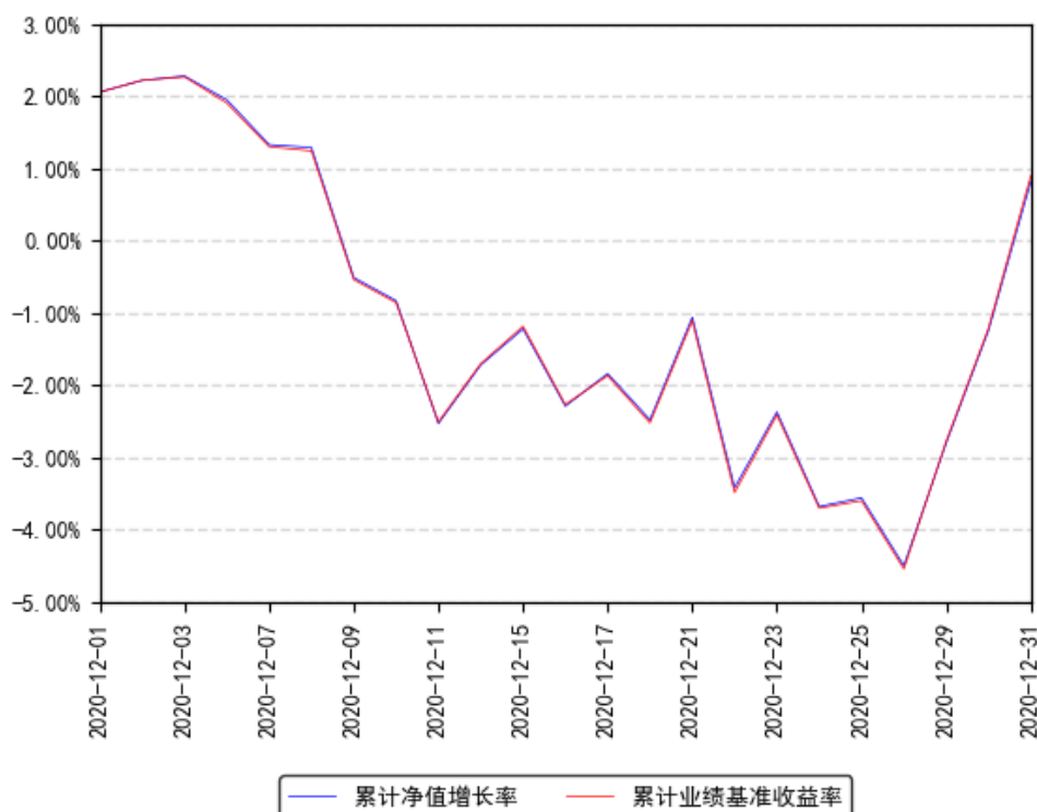
南方中证互联网指数累计净值增长率与同期业绩比较基准收益率的历史走势对比图

注：本基金转型日期为 2020 年 12 月 1 日，本基金合同于 2020 年 12 月 1 日生效，截至本报告期末基金成立未满一年；自基金成立日起 6 个月内为建仓期，截至报告期末基金尚未完成建仓。