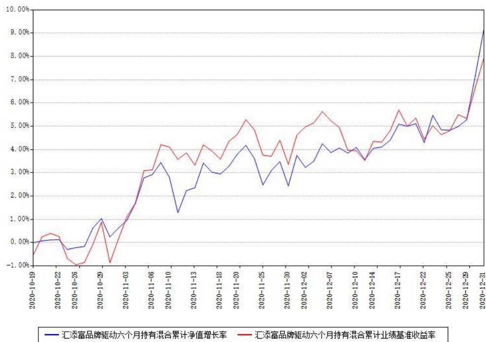
汇添富品牌驱动六个月持有混合累计净值增长率与同期业绩基准收益率对比图