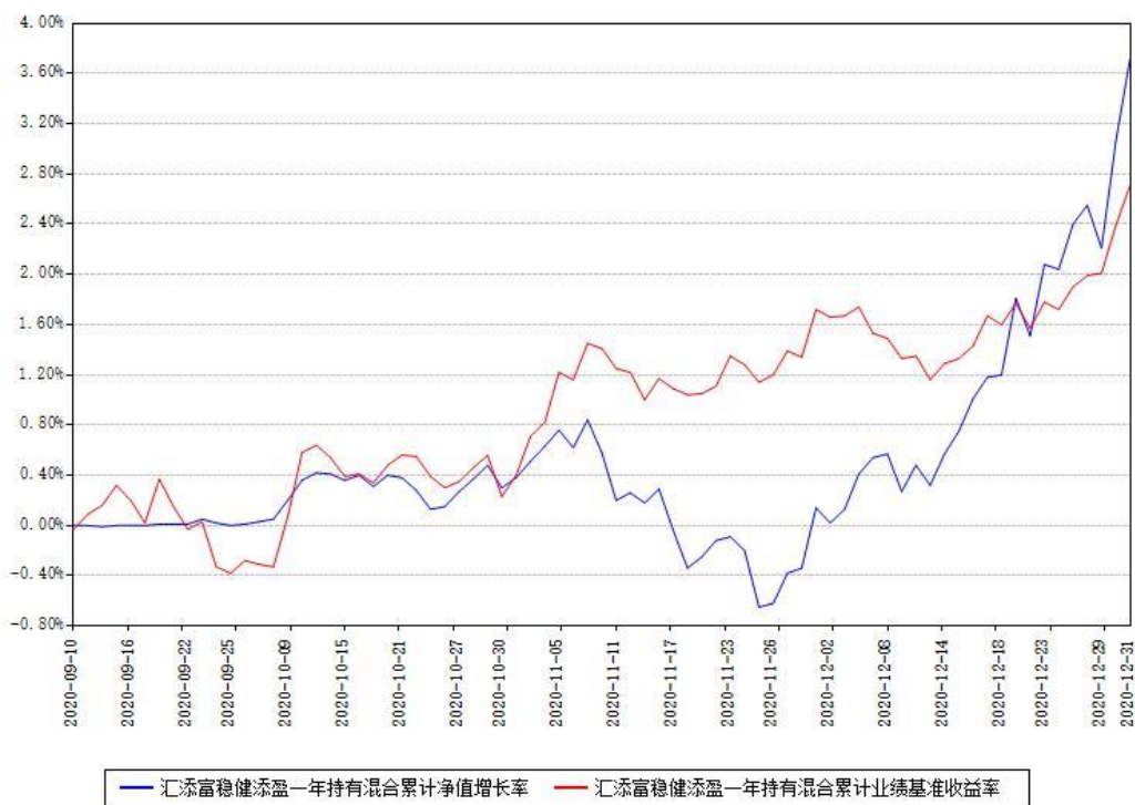
汇添富稳健添盈一年持有混合累计净值增长率与同期业绩基准收益率对比图