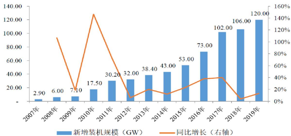
2007 年至 2019 年全球光伏新增装机容量变化情况

在人类目前大规模使用的可再生新能源中，光伏发电具有可开发利用总量大、受资源分布限制小、安全可靠高、对环境的影响小等独特优势。近年来随着光伏产业链成本的下降、光伏组件转换效率的提高，光伏发电已成为全球发展最快的可再生新能源之一。从短期趋势来看，根据 2020 年版《BP 世界能源统计年鉴》，2019 年全球光伏发电量同比增长 24.25%，远高于 12.55% 的风能发电量增速及 5.97% 的其他可再生能源发电量增速。同时全球光伏产业规模也在持续扩大，2019 年全球光伏新增装机规模达到 120GW，同比增长 13.21%。