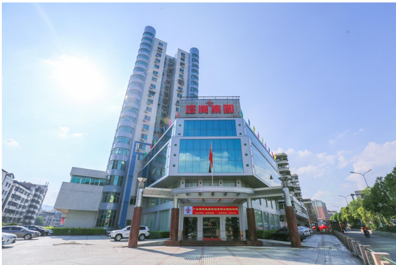
（塔牌集团办公大楼）

广东塔牌集团股份有限公司（下称：“公司”或“塔牌集团”），是一家国家水泥工业结构调整重点支持的大型水泥企业，总部位于广东省梅州市蕉岭县，于 2008 年 5 月 16 日成功登陆深圳证券交易所中小企业板，证券代码：002233，证券简称：塔牌集团。