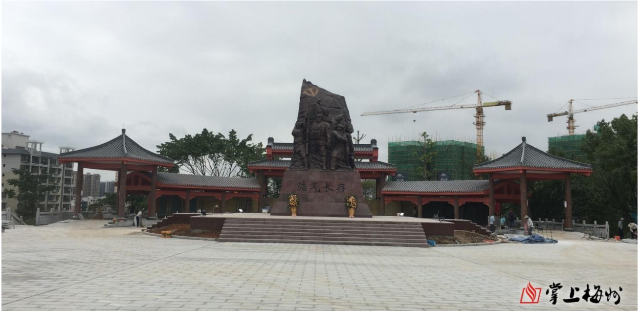
(图片说明：建设中的剑英湖红色文化公园)