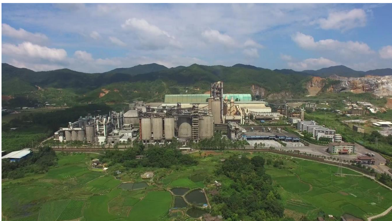
（图片说明：被评为绿色工厂的福建塔牌水泥有限公司）

塔牌集团坚持走“绿水青山就是金山银山”发展道路。自 2018 年启动建设绿色水泥工厂行动计划以来，公司着力建设绿色水泥矿山、绿色水泥工厂。2020 年，公司属下福建塔牌矿业有限公司按照《自然资源部办公厅关于做好 2020 年度绿色矿山遴选工作的通知》（自然资办函【2020】839 号）的文件精神，积极开展绿色矿山对标建设，并经自评、第三方评估、省级推荐基础上，经审核和社会公示，2020 年福建塔牌矿业有限公司被列入全国绿色矿山名录；下一步，公司将认真推进属下水泥生产企业申报列入“绿色工厂”工作。