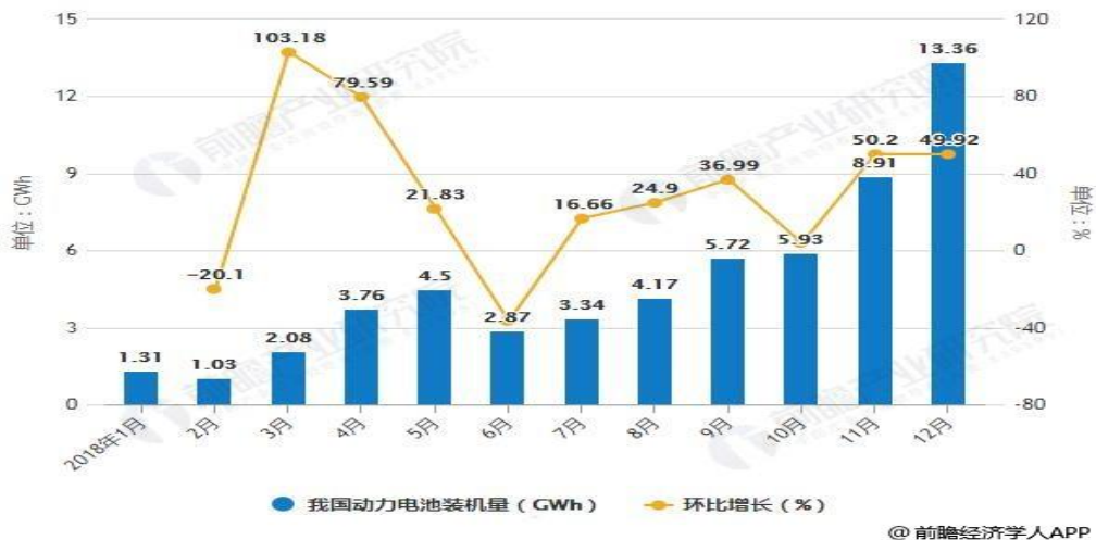
2018 年 1-12 月我国动力电池装机量统计及环比增长情况

根据动力电池应用分会研究部统计数据显示，2018 全年我国新能源汽车动力电池装机总量为 56.89GWh，同比增长 56.88%，装机量从 3 月份开始持续走高，6 月略有下滑后继续攀升，12 月装机量达到顶峰，高达 13.36GWh，环比增长 49.92%。