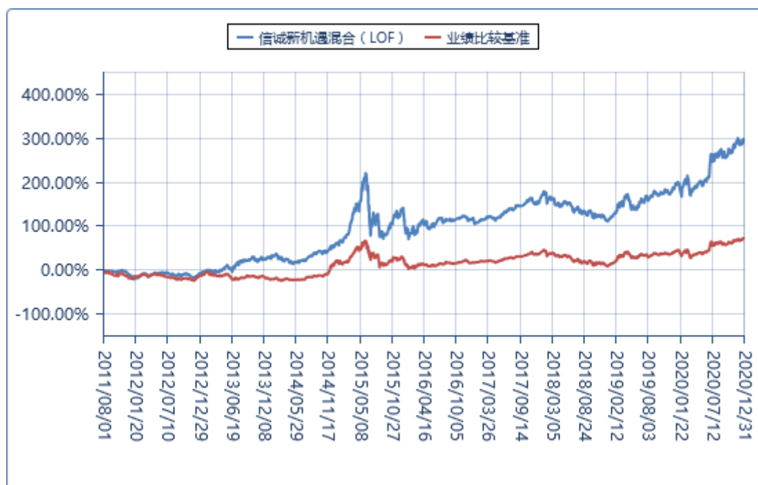
3.2.3 过去五年/自基金合同生效/自基金转型以来基金每年净值增长率及其与同期业绩比较基准收益率的比较