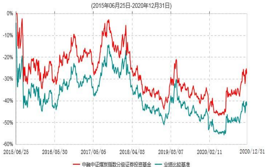
中融中证煤炭指数分级证券投资基金累计净值增长率与业绩比较基准收益率历史走势对比图

注：按基金合同和招募说明书的约定，本基金自基金合同生效日起6个月内为建仓期，建仓期结束时本基金的各项投资比例符合基金合同的有关约定。