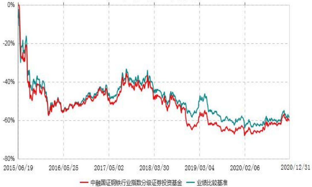
中融国证钢铁行业指数分级证券投资基金累计净值增长率与业绩比较基准收益率历史走势对比图 (2015年06月19日-2020年12月31日)

注：按基金合同和招募说明书的约定，本基金自基金合同生效日起6个月内为建仓期，建仓期结束时本基金的各项投资比例符合基金合同的有关约定。