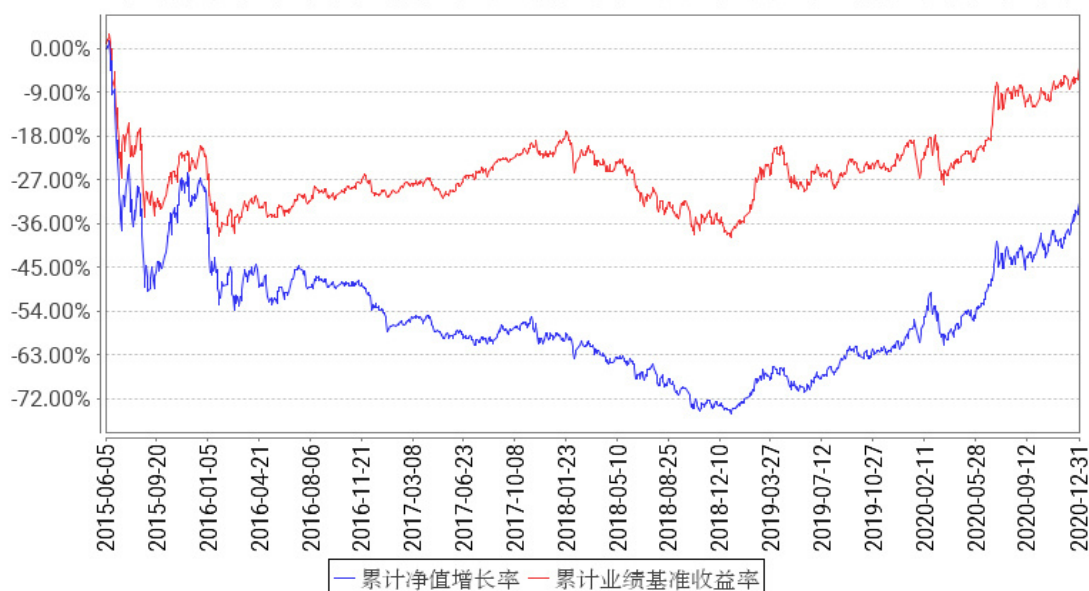
工银互联网加股票累计净值增长率与同期业绩比较基准收益率的历史走势对比图