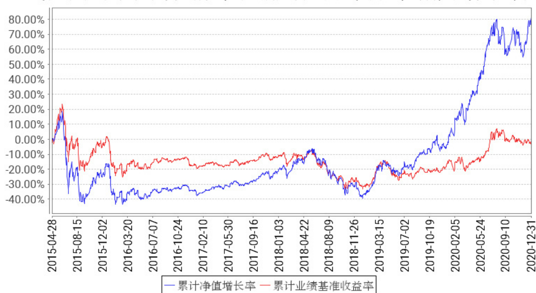
工银养老产业股票累计净值增长率与同期业绩比较基准收益率的历史走势对比图