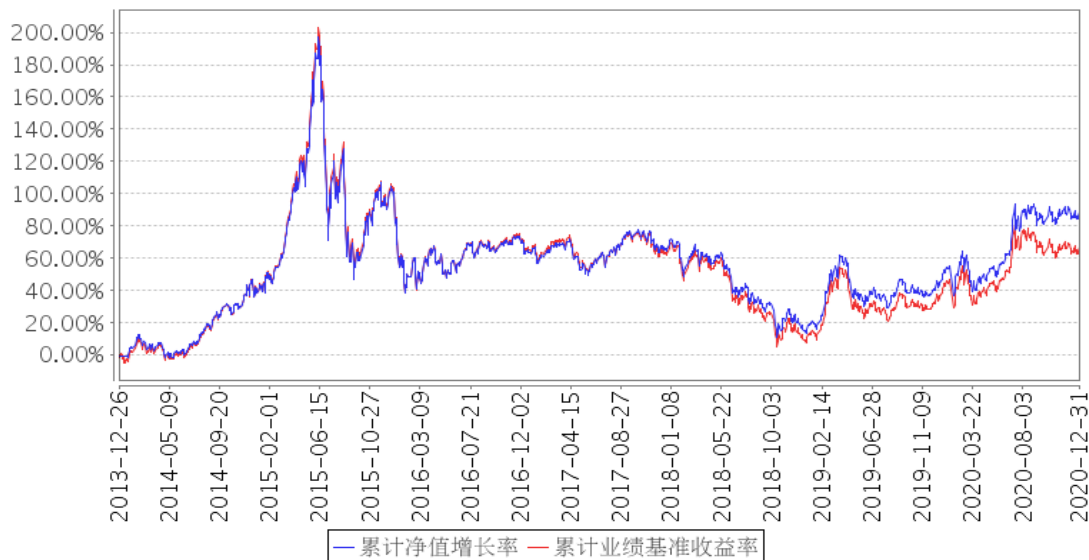
景顺长城中证500ETF累计净值增长率与同期业绩比较基准收益率的历史走势对比图

注：本基金的投资组合比例为：本基金投资范围主要为标的指数成份股及备选成份股，投资于标的指数成份股及备选成份股的比例不低于基金资产净值的 90%，且不低于非现金基金资产的 80%。本基金的建仓期为自 2013 年 12 月 26 日基金合同生效日起 6 个月。建仓期结束时，本基金投资组合达到上述投资组合比例的要求。