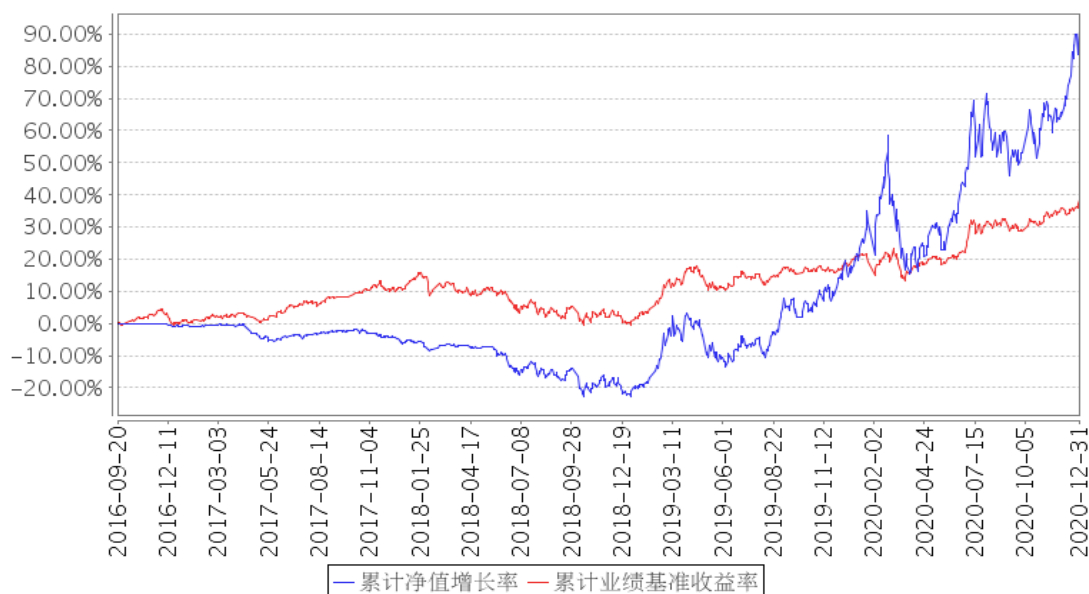
平安鼎越混合累计净值增长率与同期业绩比较基准收益率的历史走势对比图