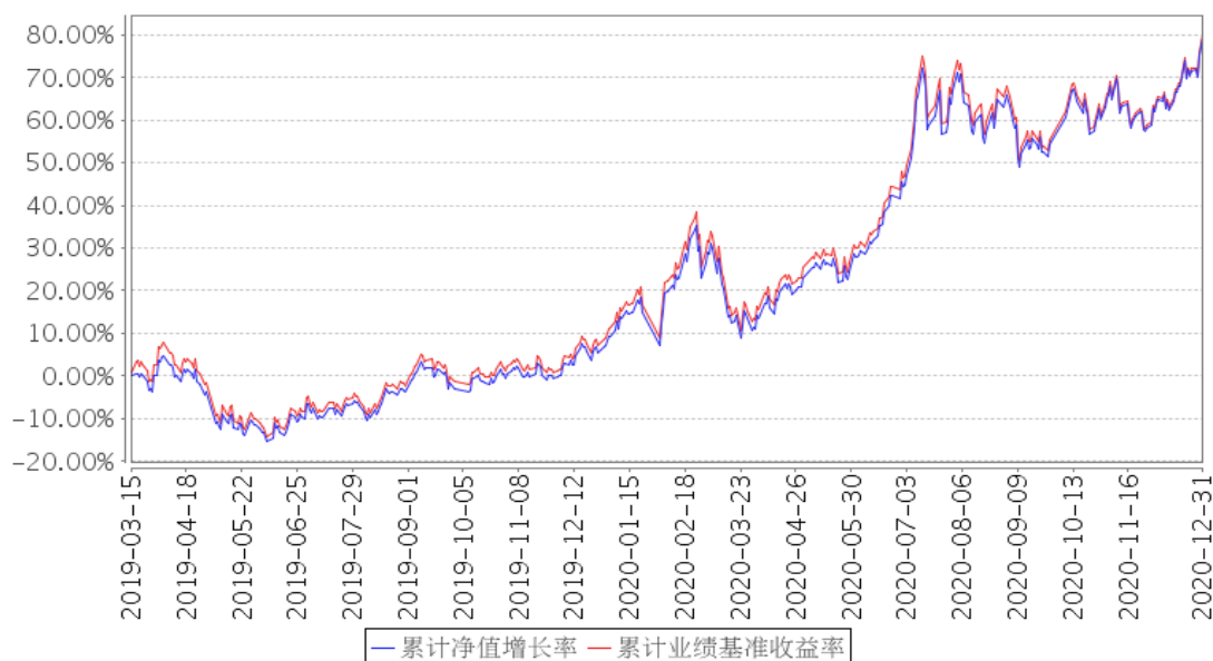
平安创业板ETF累计净值增长率与同期业绩比较基准收益率的历史走势对比图