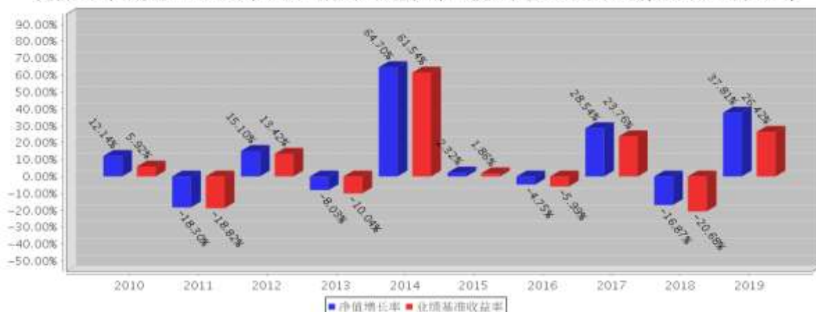
建信上证社会责任ETF基金每年净值增长率与同期业绩比较基准收益率的对比图(2019年12月31日)