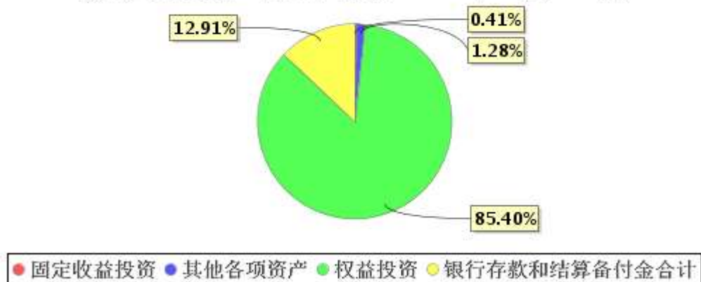
投资组合资产配置图表(2020年12月31日)