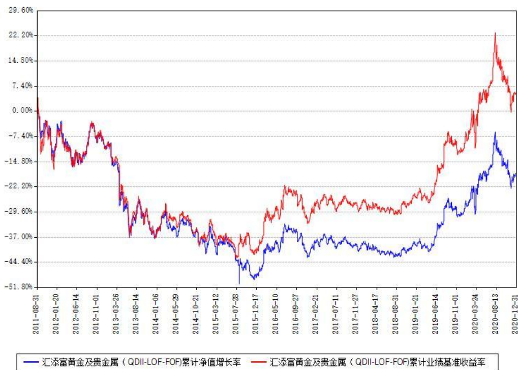
汇添富黄金及贵金属（QDII-LOF-FOF）累计净值增长率与同期业绩比较基准收益率对比图

注：本基金建仓期为本《基金合同》生效之日（2011年08月31日）起6个月，建仓期结束时各项资产配置比例符合合同约定。