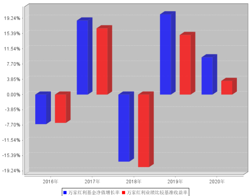
万家红利过去五年基金每年净值增长率及其与同期业绩比较基准收益率的对比图