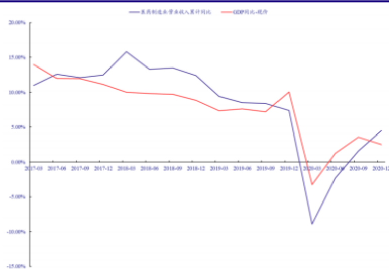
图 2.1.1: 中国医药制造业营业收入和 GDP 累计增速对比（现价计算）

近10年来，我国人民物质生活的改善，带动了持续不断的医疗升级需求，医药行业常年保持快于GDP增速的增长。医疗需求一方面来自于人口增加带来的基本医疗需求，另一方面来自于医疗升级需求带来的人均消费的提高。随着基数增大，我国医药制造业主营增速逐渐放缓，但仍然保持快于GDP的增速。2020年前三季度，受疫情冲击影响，医疗机构作为高风险地区纷纷限制营业，其他传染病也因为防疫措施得到遏制，医药需求大幅下滑，医药制造业收入增速大幅回落并低于GDP增速。2020年第四季度，医药制造业收入累计增速再次反超GDP现价累计增速。