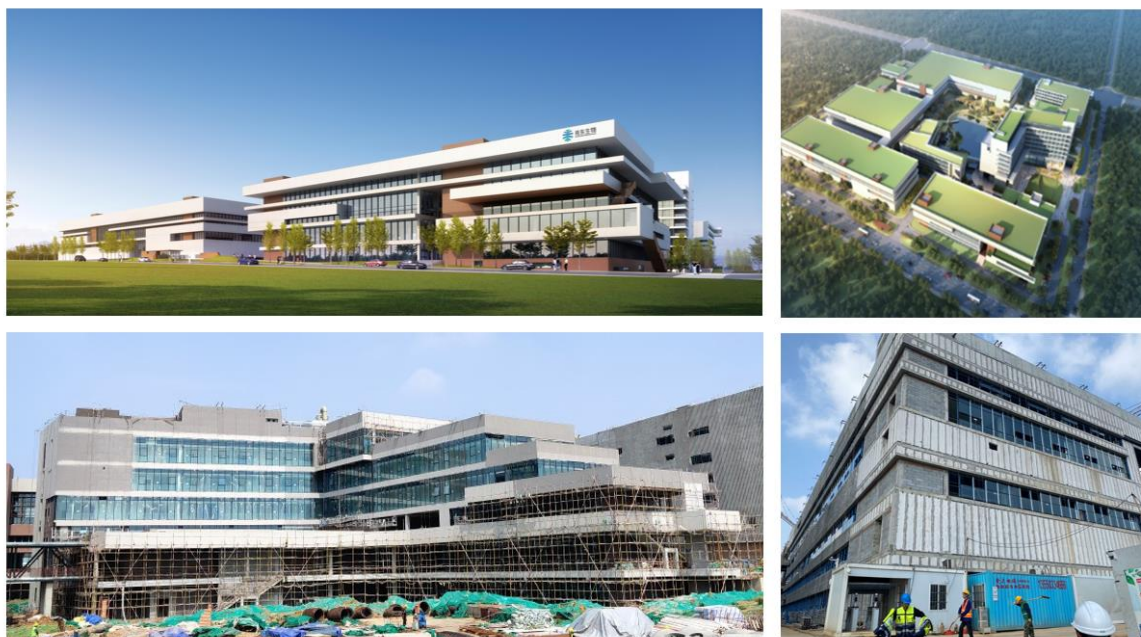
图 1 硕德药业效果图及实景