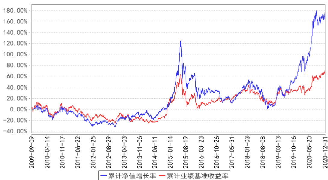
鹏华精选成长混合累计净值增长率与同期业绩比较基准收益率的历史走势对比图