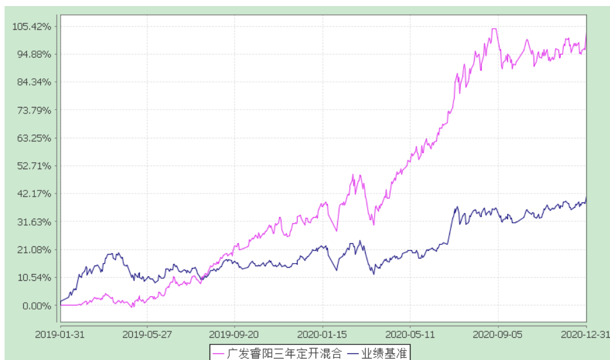
广发睿阳三年定期开放混合型证券投资基金 份额累计净值增长率与业绩比较基准收益率的历史走势对比图 (2019 年 1 月 31 日至 2020 年 12 月 31 日)