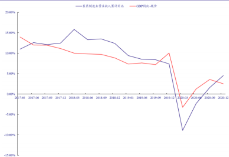
图 2.1.1: 中国医药制造业营业收入和 GDP 累计增速对比 (现价计算)

近10年来，我国人民物质生活的改善，带动了持续不断的医疗升级需求，医药行业常年保持快于GDP增速的增长。医疗需求一方面来自于人口增加带来的基本医疗需求，另一方面来自于医疗升级需求带来的人均消费的提高。随着基数增大，我国医药制造业主营增速逐渐放缓，但仍然保持快于GDP的增速。2020年前三季度，受疫情冲击影响，医疗机构作为高风险地区纷纷限制营业，其他传染病也因为防疫措施得到遏制，医药需求大幅下滑，医药制造业收入增速大幅回落并低于GDP增速。2020年第四季度，医药制造业收入累计增速再次反超GDP现价累计增速。