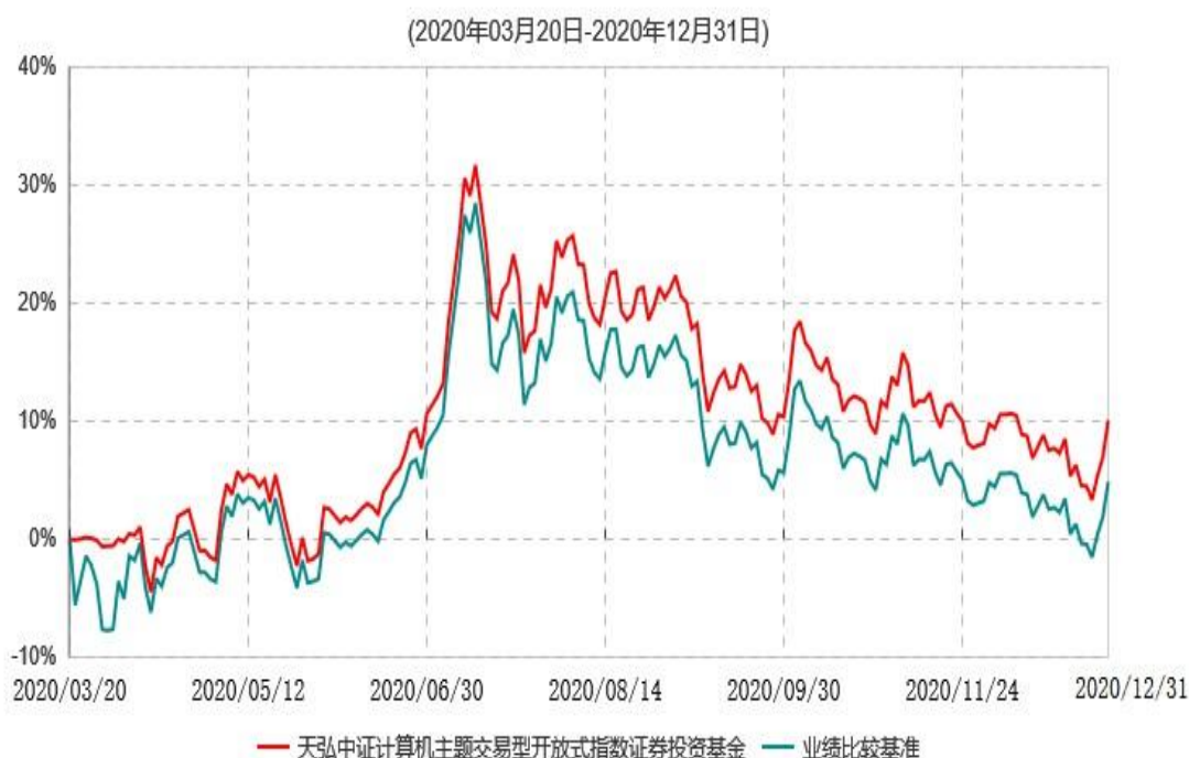
天弘中证计算机主题交易型开放式指数证券投资基金累计净值增长率与业绩比较基准收益率历史走势对比图