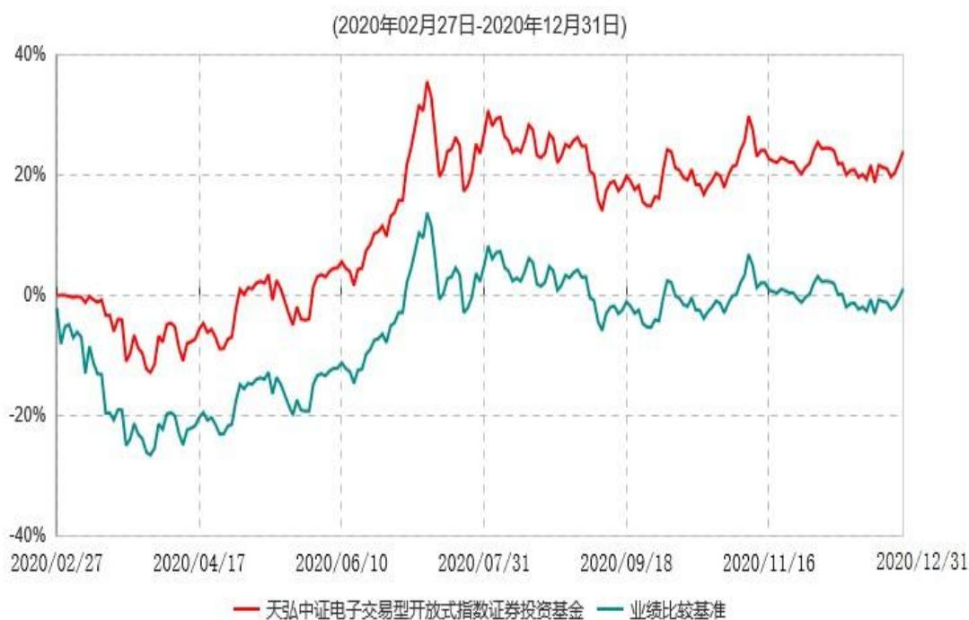
天弘中证电子交易型开放式指数证券投资基金累计净值增长率与业绩比较基准收益率历史走势对比图