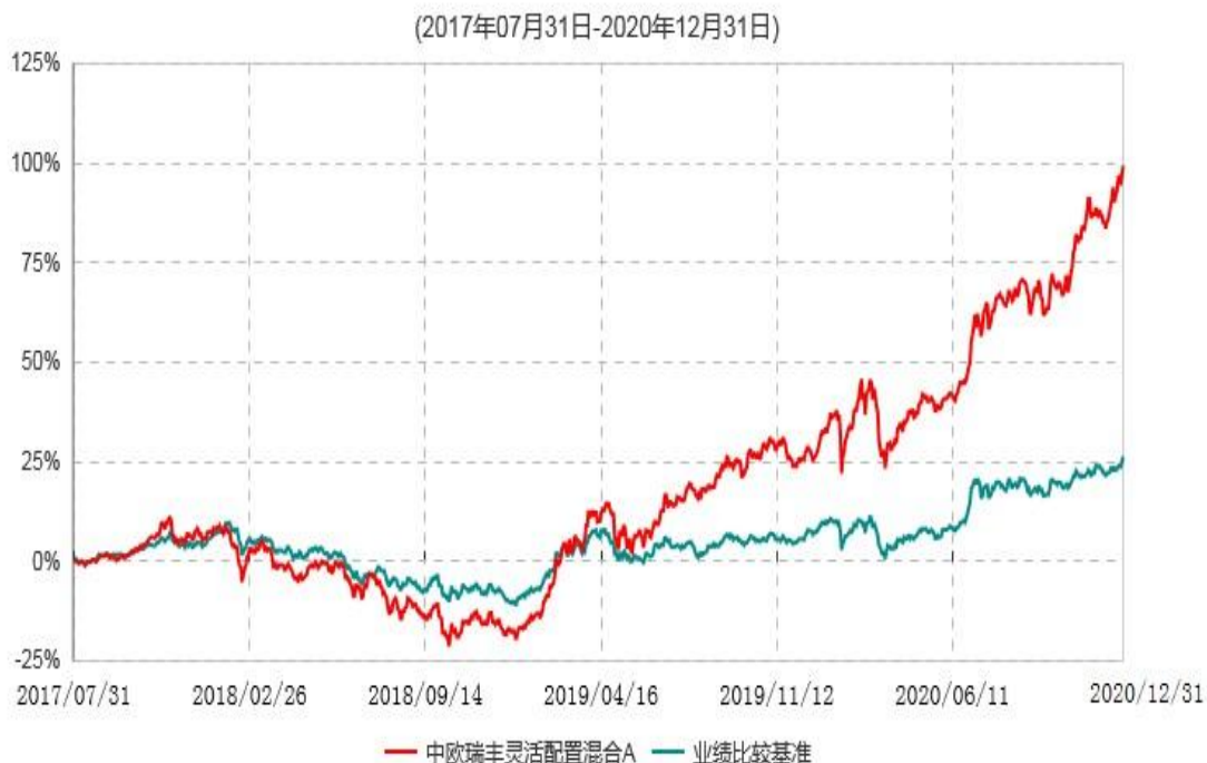
中欧瑞丰灵活配置混合A累计净值增长率与业绩比较基准收益率历史走势对比图