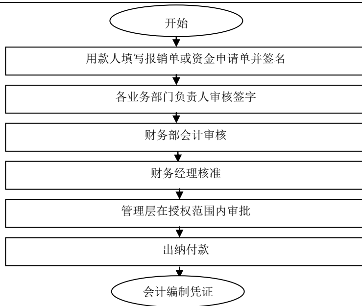
资金支付审批流程图