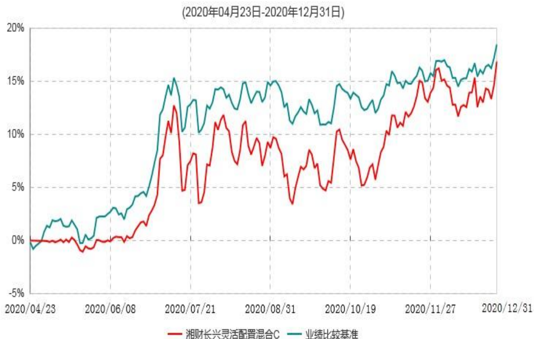
湘财长兴灵活配置混合C累计净值增长率与业绩比较基准收益率历史走势对比图